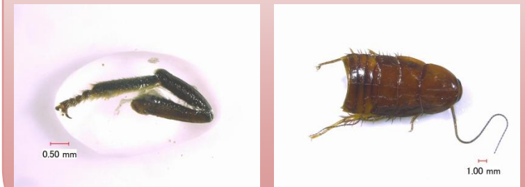
外観だけでは同定が難しい昆虫異物の例

その他の情報は弊社ホームページアドレスでご確認下さい http://food-analab.jp/